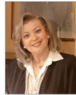
Autora de libros y de recordadas entrevistas, era hermana del asesinado senador Jaime Guzmán.

FUERTES PRESIONES, CONFLICTOS Y EL ANÁLISIS DE TRIBUTARISTAS