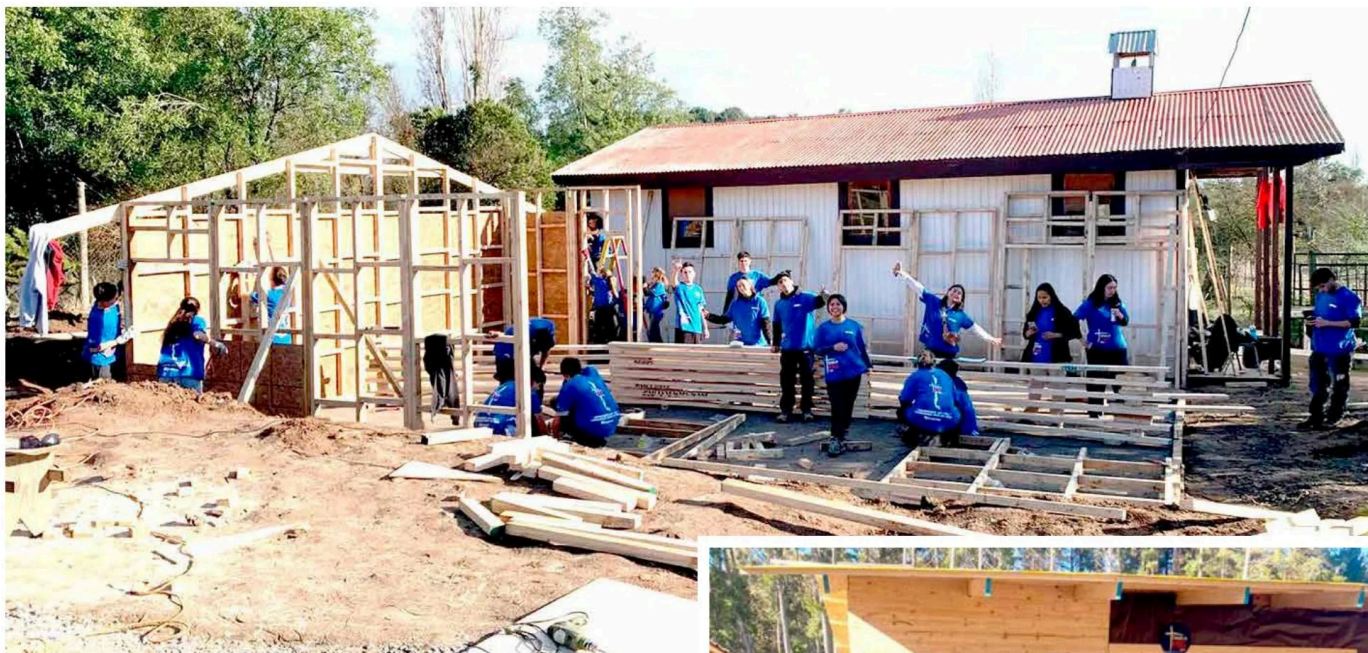
Voluntarios en el sector de Hualonco, en la comuna de Longaví.