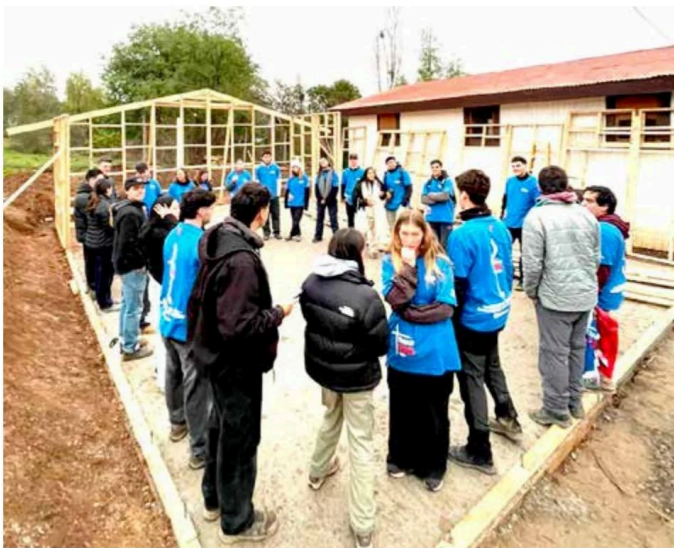
Cada día, los jóvenes voluntarios iniciaban la jornada con una oración.

• 161 jóvenes de la Pastoral de la Pontificia Universidad Católica de Chile vivieron parte de sus vacaciones en Pelarco, Longaví y Cauquenes como un tiempo para servir.