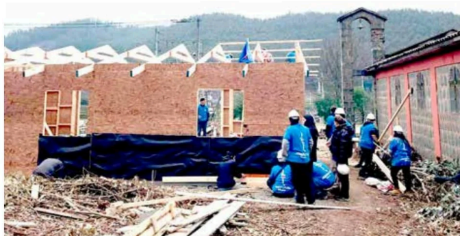
Salón Parroquial en el sector La Vega, Cauquenes.