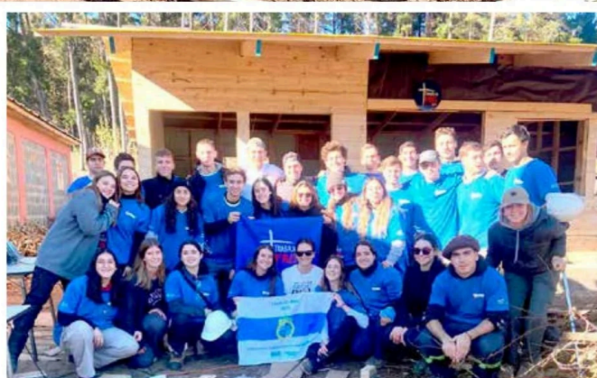
Jóvenes voluntarios en el sector La Vega, comuna de Cauquenes.

misiones y trabajos de invierno en las comunas de Pelarco, Longaví y Cauquenes. Ellos