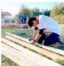
Con materiales y todas las ganas, los jóvenes realizaron diversos trabajos.