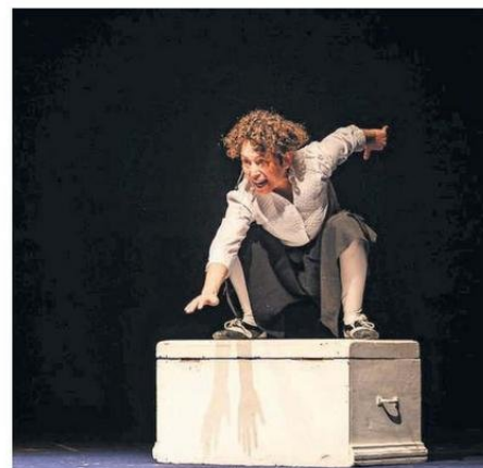
LA INICIATIVA SE ENMARCA EN EL PROGRAMA “TEATRO DEL DESIERTO”.

“Esta es la tercera instancia que levantamos como Dirección de Cultura, y actividades relacionadas al programa Teatro del De-