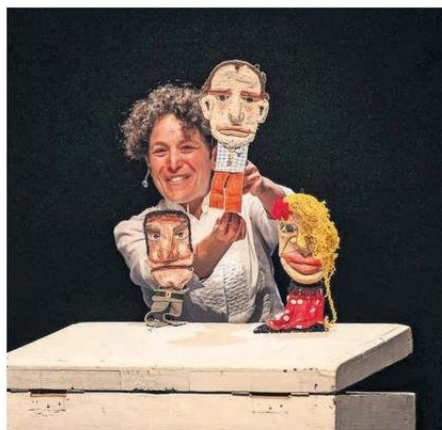
EL EVENTO FUE DE UNA GRAN CALIDAD ARTÍSTICA.