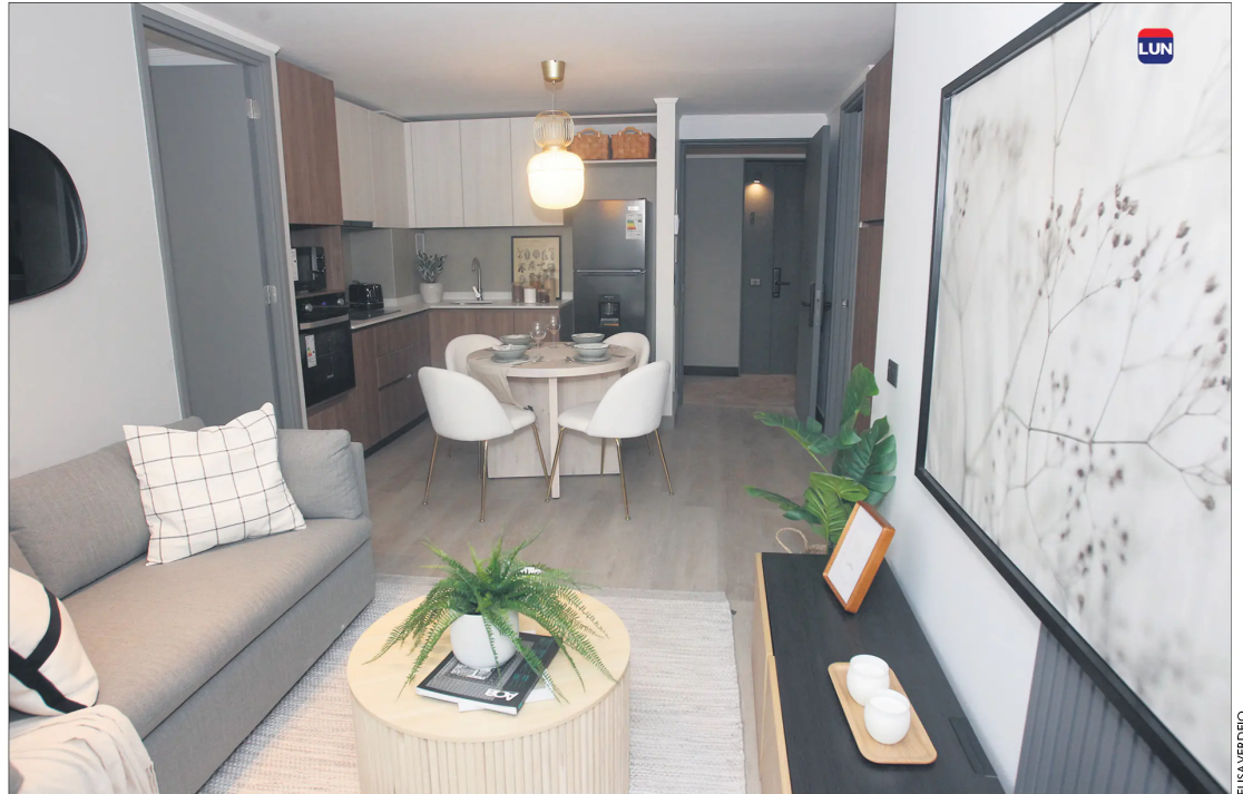
Quienes viven solos disfrutan de su rutina sin negociaciones ni roces, pero no tienen con quién compartir sus gastos.