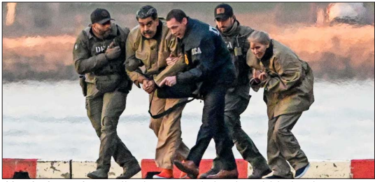
El detenido gobernante chavista Nicolás Maduro y su esposa, Cilia Flores, al ser trasladados al juzgado neoyorquino.