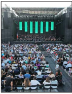
El Estadio Nacional, con entradas gratuitas, recibirá a la afamada "Carmina Burana". | A 6

CARTAS AL DIRECTOR | A 2 EDITORIAL | A 3 COMPLETA COBERTURA | A 4, A 5, B 3, C 1 y C 2