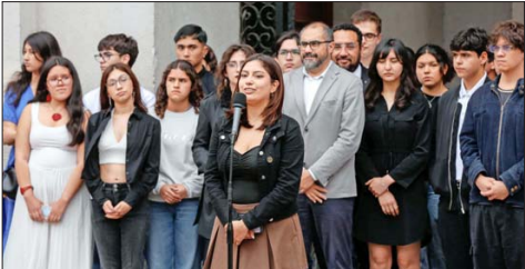
ASISTENCIA. — De los 41 estudiantes invitados a desayunar con el Presidente, 33 habían logrado los mil puntos en alguna de las pruebas.