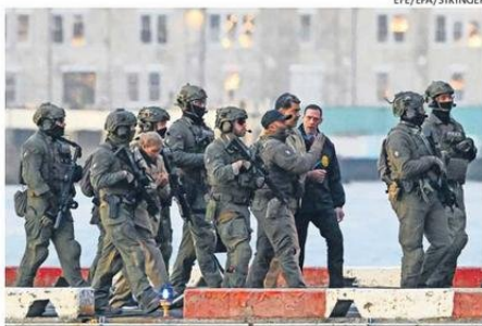
MADURO Y FLORES LLEGARON ESPOSADOS Y VIGILADOS.