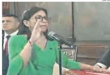
DELCEY RODRÍGUEZ JURÓ COMO PRESIDENTA ENCARGADA.