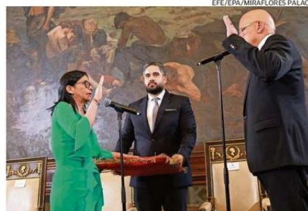
Delcy Rodríguez juró como presidenta encargada de Venezuela.