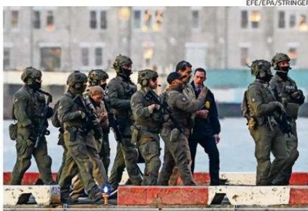
Maduro y Flores llegaron esposados y fuertemente vigilados.