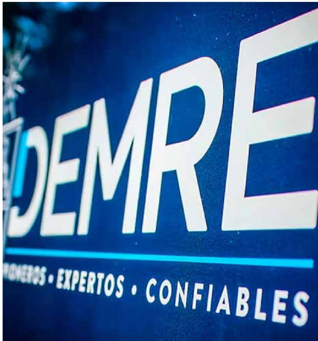
► Por 5 horas y 20 minutos un erróneo mensaje les apareció a personas que este lunes postularon a alguna carrera pedagógica.