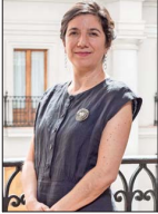
La exministra de Ciencia será la encargada del Segundo Piso de La Moneda.

LA CAÍDA DE MADURO Hasta 50 millones de barriles Primera señal de cambio: Trump afirma que Venezuela le venderá petróleo "a precio de mercado" | A 5 "No hay condiciones" para volver pronto: Tras euforia inicial, migrantes venezolanos reconocen sentir incertidumbre sobre su país | C 5