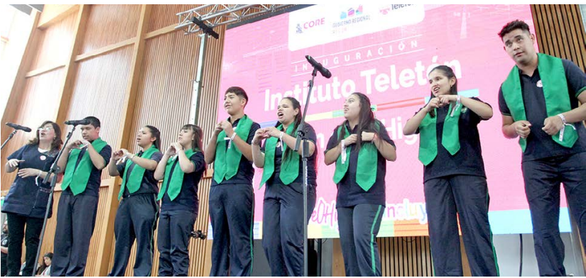
Se presentó el Coro de la Escuela Juan Tachoire Moena de Machali