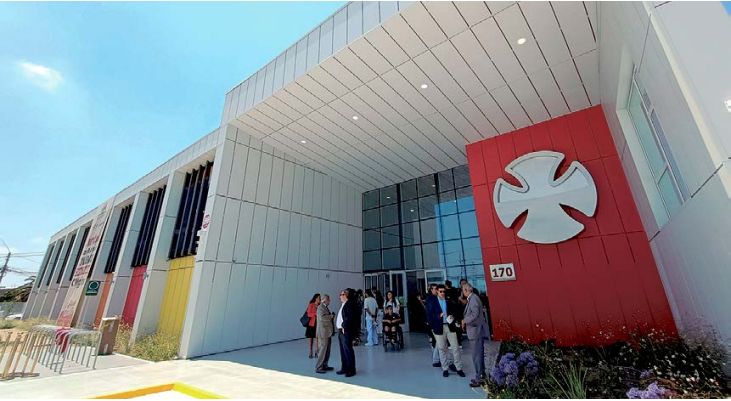
Teletón Rancagua abrió sus puertas para transformar la vida de más de 1.200 familias