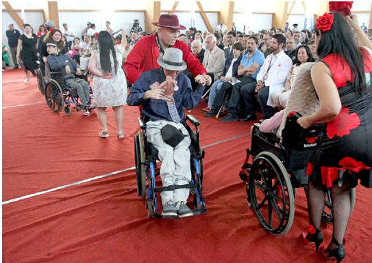
En la cita hubo cueca inclusiva con el Grupo Folclórico del Colegio Divina Esperanza.