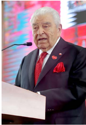
Mario Kreutzberger, don Francisco agradeció la construcción de la obra.

De este modo, desde este miércoles 7 de enero, las atenciones comienzan de manera gradual, dando inicio a una nueva etapa de acompañamiento y rehabilitación. De este modo, para la región, la llegada de Teletón es la concreción de un sueño colectivo que cuenta con cercanía, dignidad y esperanza.