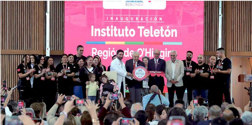
En la cita se realizó una entrega simbólica de llaves traspasando el Instituto Teletón a la fundación que hoy la administrará.