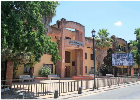
La Escuela de Cultura y Difusión Artística de Talca es uno de los tres Bicentenario que hay en Talca.

Respecto de las expectativas que existen sobre el próximo gobierno, Campos afirma que