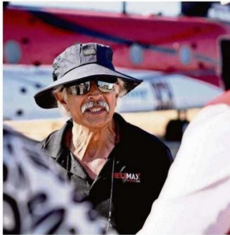
EXPERTOS DIERON A CONOCER LAS CARACTERÍSTICAS DEL HELICÓPTERO.