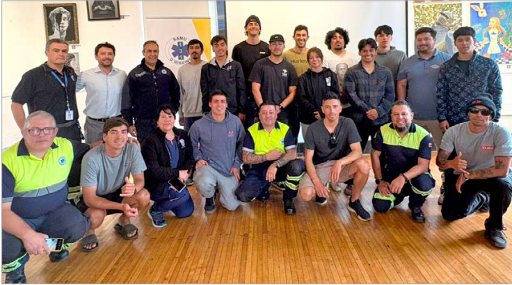
Más de 15 rescatistas municipales fortalecieron sus conocimientos en primeros auxilios.