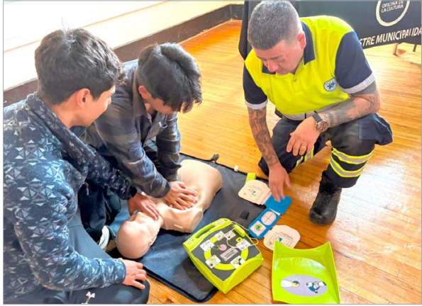
La jornada se desarrolló en el Centro Cultural Agustín Ross y abordó la cadena de supervivencia adulto extrahospitalaria.