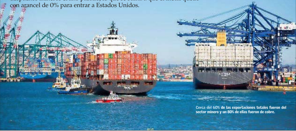
Cerca del 60% de las exportaciones totales fueron del sector minero y un 80% de ellas fueron de cobre.

Los máximos observados en la cotización del cobre aumentaron los despachos mineros el año pasado, lo que se suma a que el metal quedó con arancel de 0% para entrar a Estados Unidos.