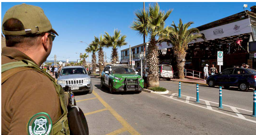
Se realizó un balance de la realidad que están viviendo comunas como Pichilemu con el inicio de la temporada estival.