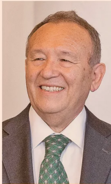
JOSÉ GARCÍA RUMINOT SEGPRES.