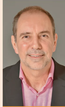
LOUIS DE GRANGE TRANSPORTES.