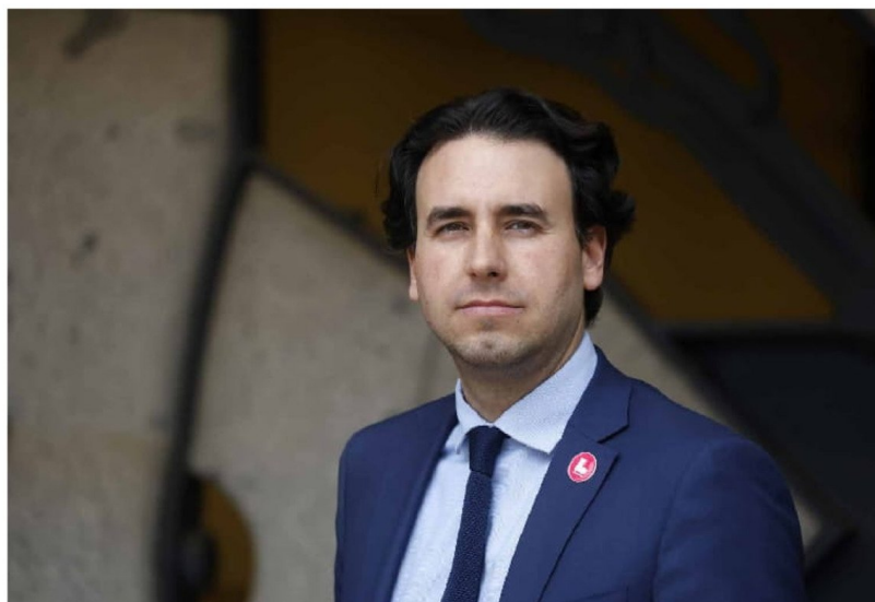
► El diputado Vlado Mirosevic, militante del Partido Liberal.