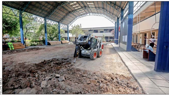
TRABAJOS.— Como parte de una inversión total de $2.800 millones, el “Plan Verano” destinará $700 millones para mejorar las condiciones de los colegios de la comuna de Santiago antes de la vuelta a clases.

diantes por sala. Entonces, hay que aislar esos factores, obviamente, para poder determinar un plan de trabajo de cómo trabajar lo que es la matrícula”.