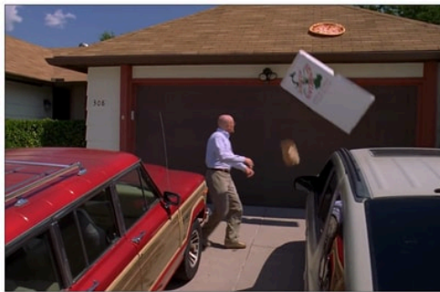
La famosa escena de Walter White versus la pizza.