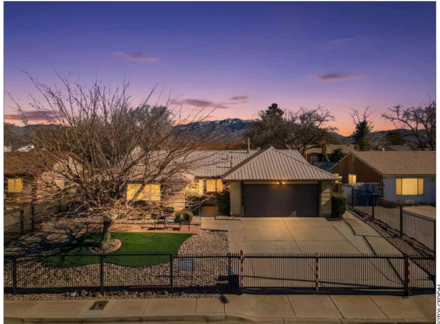
Así luce hoy la casa en Albuquerque, con la reja que impide que curiosos lancen pizzas al techo.

Sus dueños se aburrían del acoso de los fans de la serie: quisieron transformarla en museo.