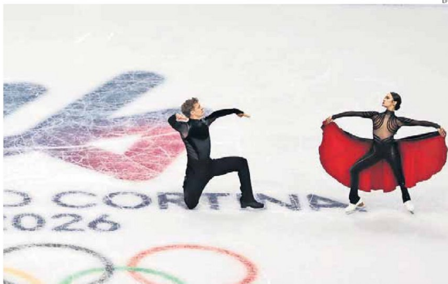
LOS JUEGOS DE MILÁN-CORTINA TIENEN 16 ESPECIALIDADES AGRUPADAS EN OCHO DEPORTES PRINCIPALES Y SEIS SEDES.

Como se dijo, el foco principal de hoy estará en el San Siro, pero será una inauguración descentralizada, ya que en paralelo habrán ceremonias en Cortina d'Ampezzo, Livigno y Predazzo. Para dar un tono distinto, habrá, además, dos pebeteros olímpicos que se encenderán hoy. Uno de ellos ubicado en el Arco della Pace de Milán y el otro en la Piazza Dibona de Cortina. Ambos, también, tendrán como inspiración en el diseño los nudos entrelazados