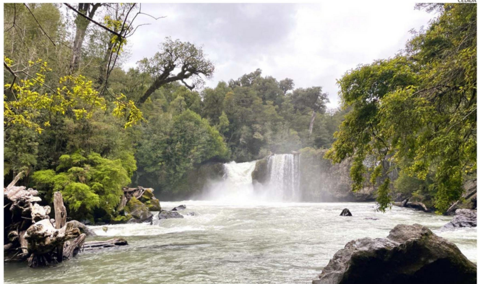
LA REGIÓN ES UNO DE LOS PRINCIPALES ATRACTIVOS TURÍSTICOS PARA LOS VISITANTES POR SUS PAISAJES NATURALES.

anual de visitantes se concentra durante los meses de verano, entre enero y marzo, en las áreas protegidas de la Región de Los Lagos.