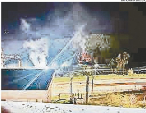
FUEGO ESTUVO CERCA DE LA EMPRESA INDURA.

Pablo Martínez Tizka cronica@estrellaconce.cl