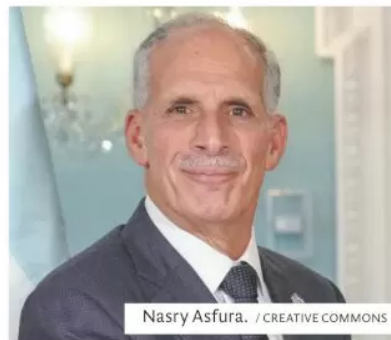
Nasry Asfura.

El presidente de Honduras, Nasry Asfura, solicitará a su homólogo estadounidense, Donald Trump, la eliminación del arancel del 10% que afecta a todos los productos hondureños exportados a Estados Unidos para que el país pueda proteger su competitividad.