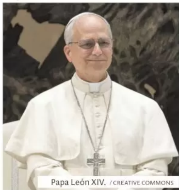
Papa León XIV.

"Expira el tratado NEW START (START III), firmado en 2010 por los presidentes de los Estados Unidos y de la Federación Rusa. Representó un paso importante para contener la proliferación de las armas nucleares y renovar los esfuerzos a favor del desarme y la confianza mutua", dijo el pontifice al final de la audiencia general.