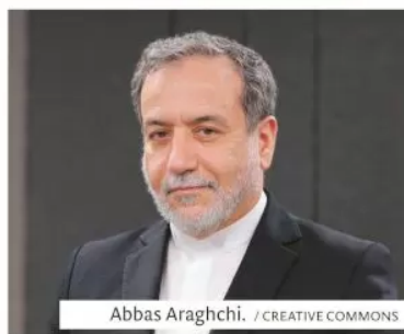
Abbas Araghchi.

Este viernes, Irán y Estados Unidos sostendrán reuniones indirectas en Mascate, capital de Omán, para abordar el programa nuclear iraní. Las negociaciones tendrán lugar en medio de las amenazas del presidente estadounidense, Donald Trump, de lanzar un ataque militar contra la República Islámica.