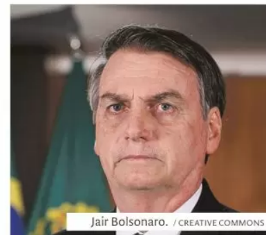
Jair Bolsonaro.