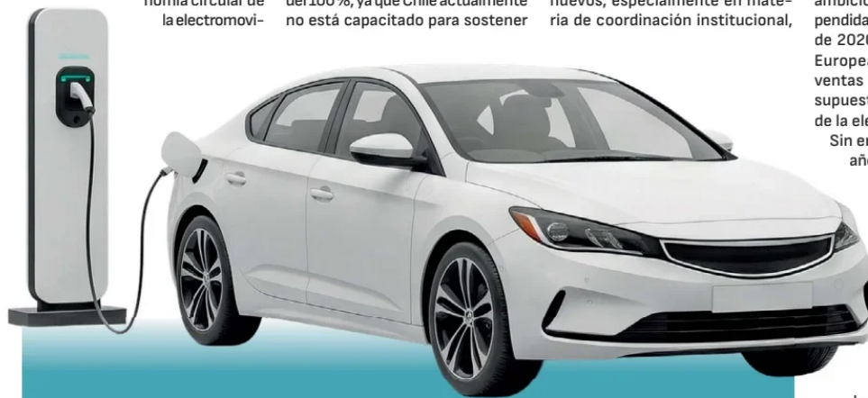
VENTAS DE BAJAS EMISIONES ALCANZAN 16,8% DEL MERCADO AUTOMOTOR