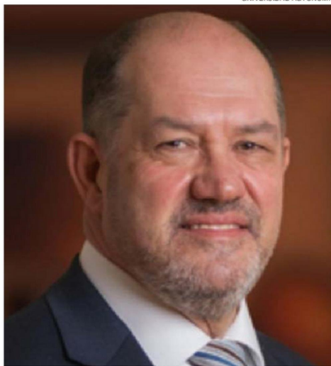
EL ABOGADO Y EXFISCAL REGIONAL, FRANCISCO LJUBETIC.

El diputado por el distrito 23, líder de Amarillos y férreo opositor al gobierno de Boric respecto de lo que ha sido el combate al terrorismo en La Araucanía,