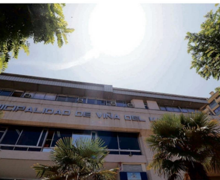
CORPORACIÓN DE VIÑA DEL MAR ES LA QUE POSEE MÁS CASOS.