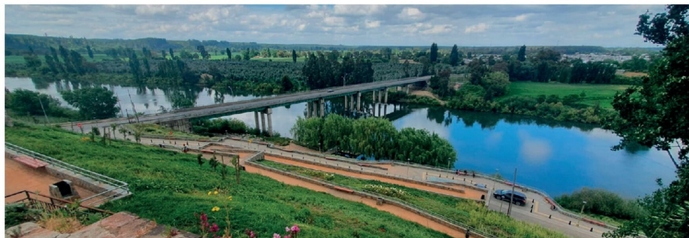
LA COMUNA DE NACIMIENTO COMBINA su historia foresto-industrial con nuevos proyectos de conectividad, desarrollo turístico y enfoque patrimonial.

Nacimiento toda la vida ha sido una comuna foresto-industrial. Yo no puedo desconocer que la comuna ha crecido