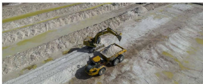
PAGOS A CORFO DE SQM Y ALBEMARLE

En esta línea, el litio experimentó durante 2025 una variación alcista, promediando en la primera mitad del año US$9.704 la tonelada de carbonato de litio; mientras que en la segunda parte US$11.284 la tonelada, en base a datos obtenidos por GEM. Entre los semestres la marca del lito observó un alza de 16%. Con esto, el promedio del año pasado fue de US$10.365 la tonelada, 18% menos que en 2024.