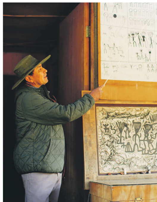
El Observatorio Turístico Cruz del Sur es uno de los principales atractivos de Combarbalá y un referente del turismo astronómico en la Región de Coquimbo.

Tanto la llamada "comuna estrella" como la conocida "tierra de los molinos, la música y la amistad" poseen un sello propio que las hace destacar entre quienes buscan experiencias turísticas enriquecedoras. Naturaleza, patrimonio, tradiciones y gastronomía se conjugan en Combarbalá y Punitaqui, dos destinos imperdibles de la provincia de Limarí.