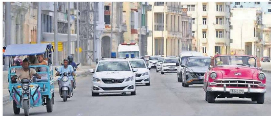
ESTADOS UNIDOS AFIRMA QUE EL RÉGIMEN CUBANO "TIENE LOS DÍAS CONTADOS" POR LA ESCASEZ DE COMBUSTIBLE A CAUSA DEL BLOQUEO