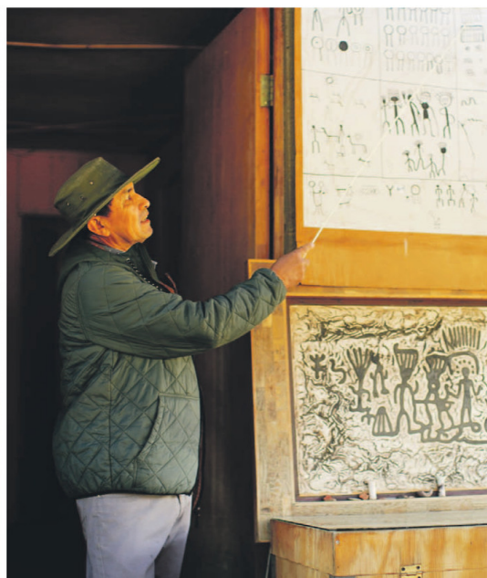
El Observatorio Turístico Cruz del Sur es uno de los principales atractivos de Combarbalá y un referente del turismo astronómico en la Región de Coquimbo.

Tanto la llamada "comuna estrella" como la conocida "tierra de los molinos, la música y la amistad" poseen un sello propio que las hace destacar entre quienes buscan experiencias turísticas enriquecedoras. Naturaleza, patrimonio, tradiciones y gastronomía se conjugan en Combarbalá y Punitaqui, dos destinos imperdibles de la provincia de Limarí.