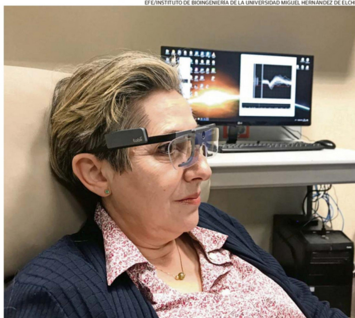
PACIENTE CIEGA, CON LENTES PARA SEGUIR SU MIRADA Y EL REGISTRO DE SU ACTIVIDAD CEREBRAL AL FONDO.

Son pasos necesarios hacia un futuro en el que "vamos a ser capaces de hacer muchas cosas que todavía hoy no son