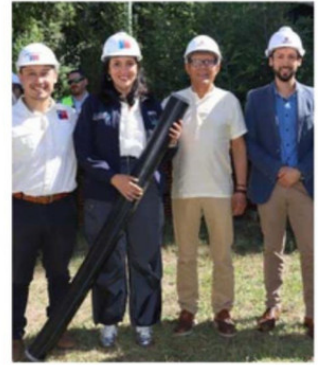
LA OBRA BENEFICIARÁ A 358 FAMILIAS.