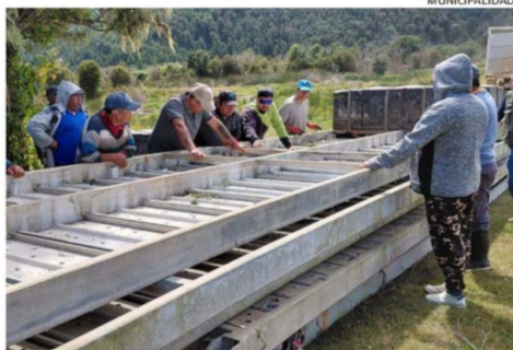
LOS VECINOS RECIBIERON LAS ESTRUCTURAS Y AHORA ESTÁN FELICES.

equipo en terreno, comentó que ayudará a evitar caídas y a manejar la carga con mayor seguridad durante las faenas.