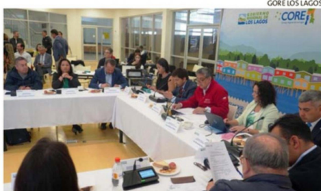
LA APROBACIÓN FUE EN EL ÚLTIMO PLENARIO DEL CORE, EN PALENA.

El gobernador regional, Alejandro Santana (RN), recaló que el programa "apunta a mejorar la productividad, incorporar economía circular y generar mayor valor agregado, apoyando directamente a trabajadores, pymes y empresas del sector. Aquí estamos