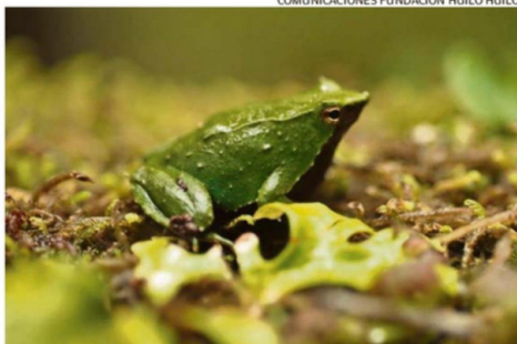
COMUNICACIONES FUNDACIÓN HUILO HUILO.

Explicó que el convenio contempla una serie de acciones, entre ellas, "una participación activa de nuestros guardaparques en las labores de monitoreo de la especie para lo cual recibirán apoyo técnico y capacitación de parte de la ONG Ranita de Darwin. Adicionalmente, se realizarán instancias de sensibilización y capaci-