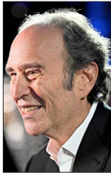
Xavier Niel, controlador de Millicom.