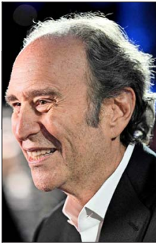
Xavier Niel, controlador de Millicom.

Xavier Niel es un empresario francés dueño del grupo Iliad, una de las mayores proveedoras de internet y telefonía del país galo, que opera bajo la marca Free Mobile. Niel controla más del 40% de Millicom, a través de distintos vehículos de inversión.