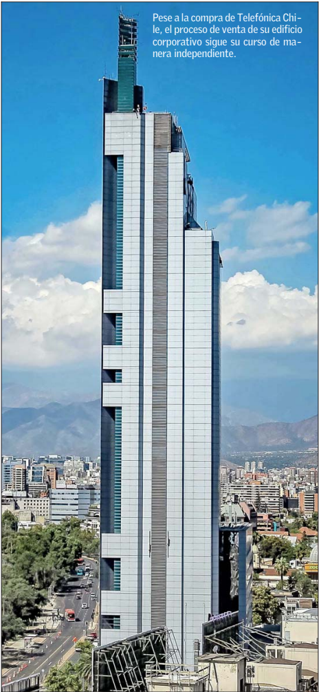
Pese a la compra de Telefónica Chile, el proceso de venta de su edificio corporativo sigue su curso de manera independiente.

Millicom opera en más de 10 países de la región bajo la marca Tigo. Esto incluye a Colombia, Ecuador y Uruguay, negocios que también fueron adquiridos a Telefónica en estos países durante el último año.