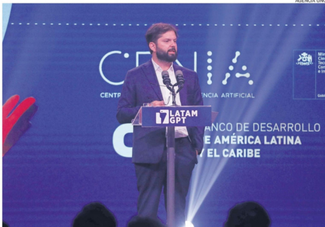
BORIC ELOGIÓ LA PRESENTACIÓN EN EL SUPER BOWL DE BAD BUNNY.

“El concierto de Bad Bunny fue un acto geopolítico. Cuando el presidente de Estados