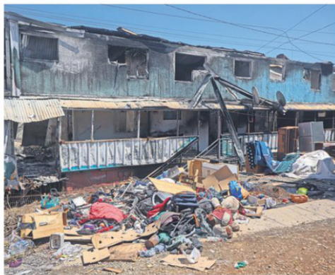
El sector fue uno de los más afectados por los incendios.

base de las 720 familias propietarias de inmuebles.