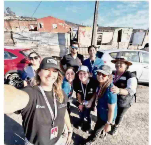
LOS EQUIPOS DE FUNDACIÓN LAS ROSAS HAN LLEVADO UN MENSAJE DE ESPERANZA A LAS ZONAS SINIESTRADAS.