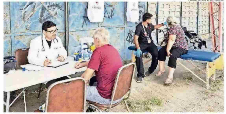
ESPECIALISTAS ADVIERTEN QUE LA INHALACIÓN DE HUMO Y EL ESTRÉS PROLONGADO PUEDEN GENERAR AFECIONES RESPIRATORIAS Y MUSCULARES DE LARGA DURACIÓN EN PERSONAS MAYORES.

sistir por meses y verse agravadas por el impacto emocional de haber perdido sus viviendas, situación que se manifiesta en contracturas, angustia y señales de posible depresión. Fundación Las Rosas ha atendido a más de un centenar de personas mayores y anunció un nuevo operativo. CS