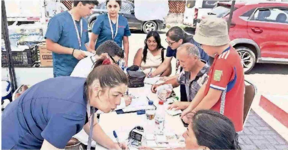
MUCHAS VÍCTIMAS SIGUEN DURMIENDO EN EL SUELO O EN CARPAS, SITUACIÓN QUE PROFUNDIZA EL DETERIORO FÍSICO Y EMOCIONAL.