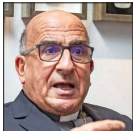
El arzobispo tiene una colección de más de 50 celulares en su hogar.

"Me gustan mucho la avenida Italia y Ñuñoa. Solvo todo, donde tengo el teatro El Cachafaz, en Av. Italia 1679. Está buenísimo porque no es tan ostentoso y se mezcla lo social, por el tema de que en Chile la gente va a ciertos barrios y a otros no. En barrio Italia se unen las segmentaciones sociales y me gusta esa diversidad. La calle se transformó en espacio peatonal donde la gente pasea, hay lugares para tomar café y reunirse también".