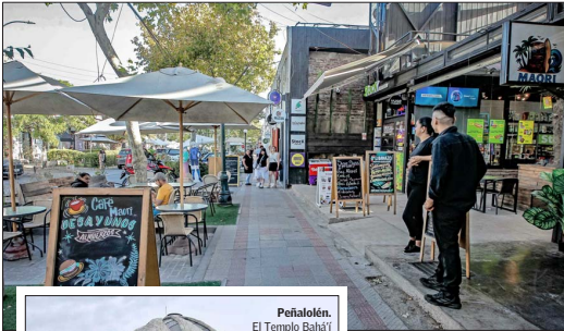
PROVIDENCIA.— El barrio Italia congrega a anticuarios, restaurantes y emprendedores.

"Mi lugar favorito es el barrio donde trabajo y tengo amigos: Lastarria. Intentamos que sea un barrio más lindo y amable, procuramos recuperarlo. Tiene de todo. Está el teatro Itcus, El Biógrafo, y una cantidad de restaurantes fantásticos y variados; también hay hoteles y mucho turismo. Me encanta que todos los días hay cambios y puedes conocer a más gente. Cada vez está más amable y tranquilo. El Museo de Bellas Artes y el Parque Forestal también son mis lugares favoritos para caminar, recorrer y disfrutar las cosas buenas que se han creado en el último tiempo".