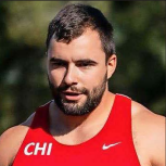
Ganó oro en el lanzamiento de disco en los Panamericanos de 2023.

Es autor de reconocidas obras como "El nadador", "La ciudad anterior" y "El verano y toda su ira".