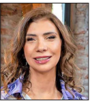
Participa como inversionista ángel en emprendimientos del área de tecnología y social.

"Diría que el barrio Italia, porque representa muy bien lo que creo que una ciudad necesita para estar viva. Es un barrio con identidad, con vida de barrio real. Hay emprendedores, comercio de autor, anticuarios, diseño, espacios culturales, e incluso canales de TV, como Porciv TV; se mezclan oportunidades de emprendimiento con espacios para la bohemia. Esa combinación lo hace un lugar muy rico en cultura, entretenimiento, creatividad y colaboración. Y también IF (su plataforma), que está ahí mismo, porque nació con esa lógica: que las ideas se encuentren y se transformen en proyectos. Cuando tienes barrio, comunidad y creación conviniendo, la innovación deja de ser un discurso y se vuelve algo concreto".