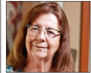
Fue la primera mujer en ganar el Premio Nacional de Ciencias Exactas (1997).

SANTIAGO DE CHILE, JUEVES 12 DE FEBRERO DE 2026 nacional@mercurio.cl