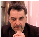
Ha participado en las películas "La buena vida", "Dios me libre" y la serie "Profugos".

"Mi lugar favorito en Santiago es mi cerro Calán, en Las Condes, donde está el Observatorio Astronómico Nacional, que ha sido mi domicilio científico desde hace casi 60 años. Ese es el sitio en el que me siento más cómoda y a gusto. Hoy está preciso, le han hecho un paseo alrededor desde donde se puede observar toda la ciudad".