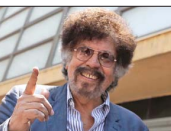
Conocido como "Compadre Moncho", su personaje en la serie televisiva Los Venegas.

"Mi lugar favorito en Santiago es mi taller en Independencia. Tenemos un jacarandá con sus flores moradas; es una belleza. Me encanta que mi lugar de trabajo esté en un barrio con historia. He encontrado las telas sobre las que pinto; estoy cerca de La Vega, de la Cristalería La Paz y del centro; de la Iglesia de la Fundación Los Riscos y de los Franciscanos; de varios edificios patrimoniales, cuya historia me encanta sentir. Varios de mis proyectos han sido inspirados en la ciudad de Santiago y sus barrios: Recoleta, en los cementerios y en las ferias. Franklin, el Museo de Arte Colonial de San Francisco en la Alameda y el Montecarmelo, en Providencia. Aprecio desmenuzarme y encontrar inspiración en estos recorridos; también busco en archivos fotografías antiguas que me hablan de cómo se ha ido construyendo Santiago. Me gusta habitar la ciudad, conocer nuestro patrimonio. Me da mucha pena que los santiaguinos tengamos miedo de salir y recorrer nuestras calles".