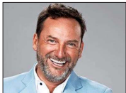
Actualmente anima el programa "El medio día", de Televisión Nacional de Chile.

"En general, es el Parque O'Higgins, pero básicamente la calle Beauchef. Yo viví muy cerca y pasó toda mi infancia ahí. Siempre trato de ir para allá, me conecto mucho".