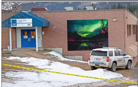
LA POLICÍA puso bajo resguardo la zona cerca de la escuela secundaria Tumbler Ridge, donde ocurrió el ataque.