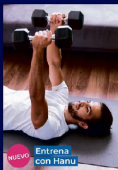
NUEVO Entrena con Hanu

En un contexto de alta demanda y barreras de acceso, la salud digital se ha convertido en una respuesta concreta para mejorar la experiencia de las personas. Blua, el ecosistema de salud digital de Bupa, integra tecnología e inteligencia artificial para acompañar a los pacientes de forma más simple, resolutive y personalizada.