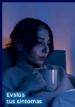
Evalúa tus síntomas