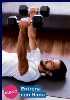
NUEVO Entrena con Hanu

En un contexto de alta demanda y barreras de acceso, la salud digital se ha convertido en una respuesta concreta para mejorar la experiencia de las personas. Blua, el ecosistema de salud digital de Bupa, integra tecnología e inteligencia artificial para acompañar a los pacientes de forma más simple, resolutive y personalizada.