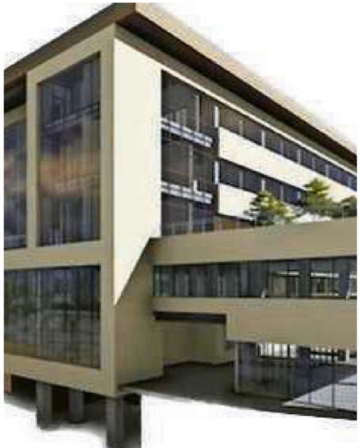
DIRIGENTES CONFÍAN EN AVANCE DEL PROYECTO EN LA UNIÓN.

Sin embargo -afirmó- ninguno de esos escenarios inhabilita que las obras puedan seguir ejecutándose.