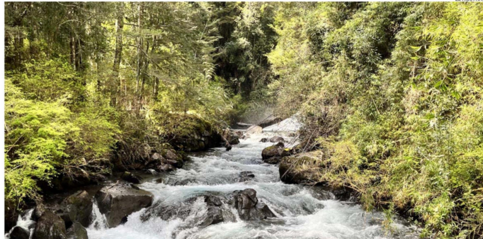
EL SENDERO EL PUMA, QUE ES DE BAJA COMPLEJIDAD, PASA POR UNAS ZONAS DE BELLEZA NATURAL PRIVILEGIADA EN ANTICURA.

Conaf para dar cuenta de emergencias, incendios forestales o actividades sospechosas en parques nacionales, al igual que se pueden ingresar las denuncias al 133 de Carabineros.