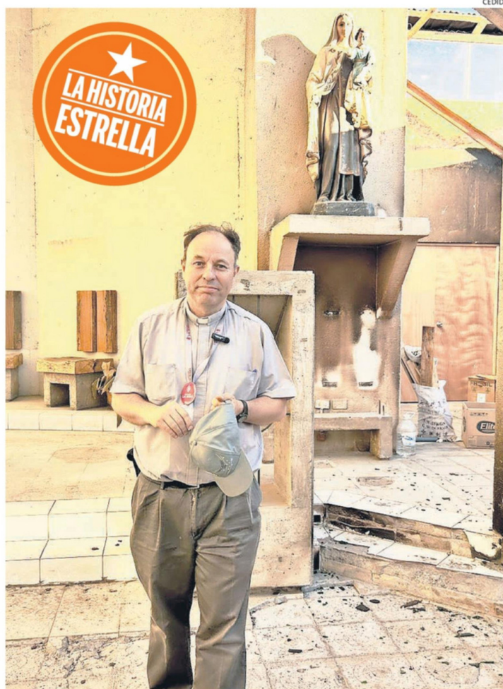
EL CAPELLÁN DE FUNDACIÓN LAS ROSAS HA ESTADO TRABAJANDO EN PENCO Y PUNTA DE PARRA.

acompañamiento emocional y espiritual junto al apoyo material y sanitario?