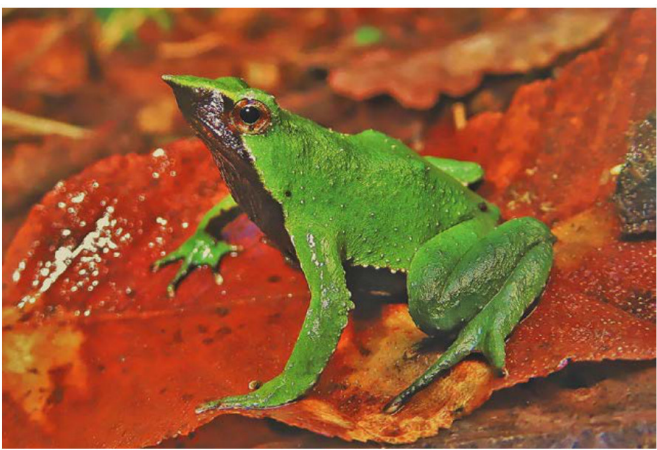
Ranita de Darwin (Rhinerderma darwini).