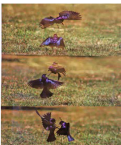
Mirlos (Molothrus bonariensis).